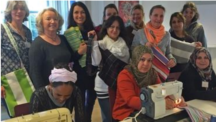
Das Führungsteam des Vereins mit der Bad Endorfer Nähgruppe

"Wir haben uns abgestimmt mit dem Landratsamt und gefragt: Was können die Menschen brauchen? Und die haben uns gesagt: Ganz einfache Dinge! Wie zum Beispiel eine Tasche, wo Dokumente und Papiere reinkommen. Die Flüchtlingsfrauen wollen sich einbringen. Und wir wollen, dass sich Flüchtlinge ehrenamtlich in die Gesellschaft einbringen können."